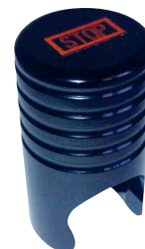
Verrouillage du débitmètre Flow Lock

pour du débit continu uniquement. Conforme à la norme 8359/A1. Référence : 1561321