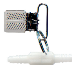
Connection tubulure tournant avec clip