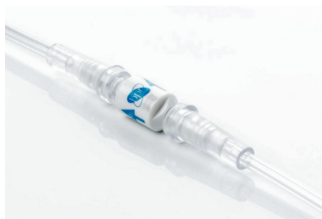
Dispositif d'interruption du flux d'oxygène

pour du débit continu uniquement. Conforme à la norme 8359/A1. Référence : 1561321