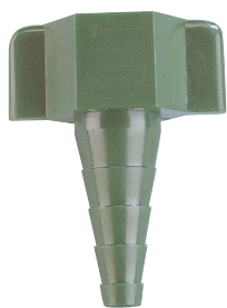
Connecteur tubulure universel pour cuve à oxygène