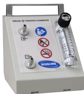
Débitmètre pédiatrique - de 50 à 750 cc/mn