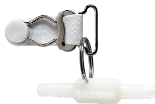
Connecteur tubulure tournant avec clip pour tissu délicat