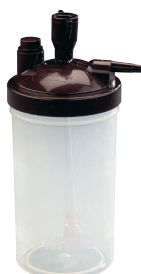
Humidificateur Platinum 9